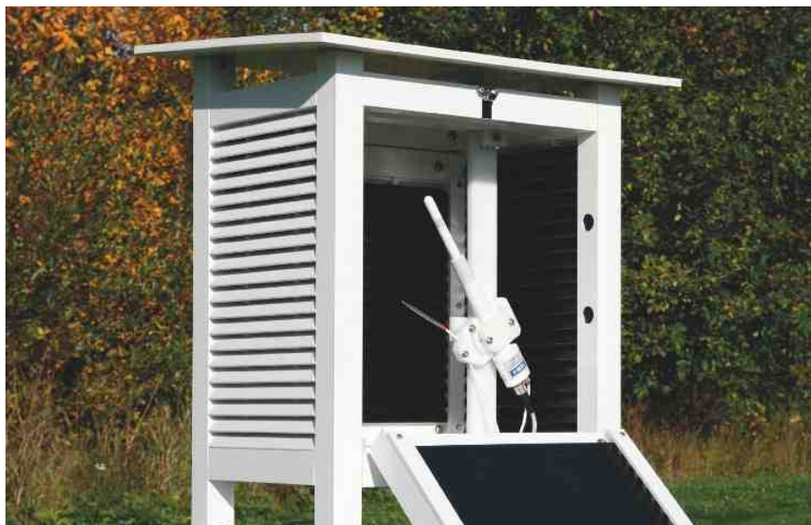
HMP155 с дополнительным датчиком температуры.

Датчик Vaisala HUMICAP® HMP155 обеспечивает высокий уровень надежности измерения влажности и температуры. Разработан специально для выполнения ответственных задач на открытом воздухе.